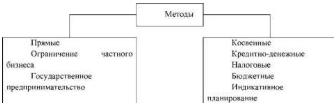
Рисунок 1 - Прямые и косвенные методы государственного регулирования После названия рисунка следует пропустить одну пустую строку и продолжить текст работы.

Таблицы применяют для лучшей наглядности и удобства сравнения показателей. Название таблицы, при его наличии, должно отражать ее содержание, быть кратким. Таблицы, за исключением таблиц приложений, следует нумеровать арабскими цифрами сквозной нумерацией. Допускается нумеровать таблицы в пределах раздела. В этом случае номер таблицы состоит из номера раздела и порядкового номера таблицы, разделенный точкой (например - Таблица 1.2). Название таблицы следует помещать над таблицей слева, без абзачного отступа в одну строку с ее номером через тире. При переносе таблицы над ней размещают слова «Продолжение таблицы» с указанием ее номера (например, Продолжение таблицы 1). Заголовок таблицы не повторяют. На все таблицы документа должны быть приведены ссылки в тексте (например, см. табл. 1.3). Если рисунок или таблица взяты из литературного источника, то после названия делается ссылка на номер этого источника в списке литературы. Пример оформления: